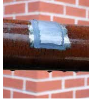
在潮湿或油污的表面上进行施工