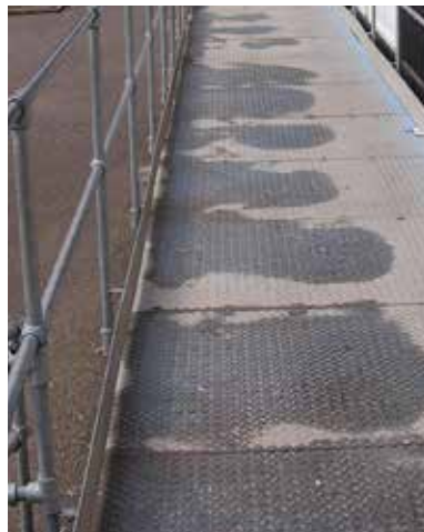
敷涂施工前的磨平钢材坡道