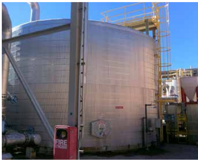
贝尔佐纳 (Belzona) 4341 可用作内衬，为储罐提供保护