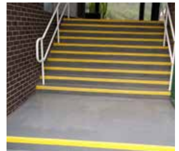
施工后的混凝土楼梯