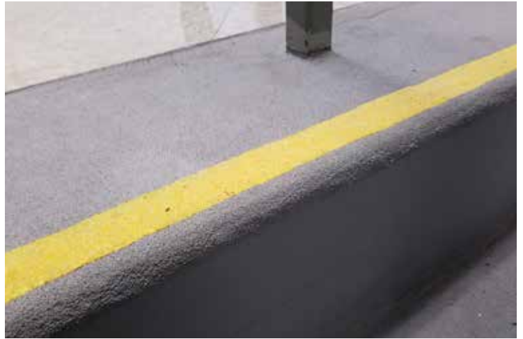
投入使用一年以上的贝尔佐纳 (Belzona) 4411 特写图