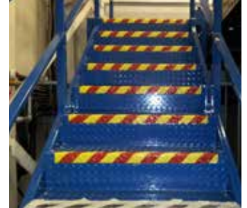
施工后的金属楼梯