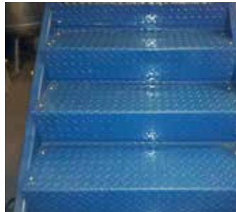
施工前的金属楼梯