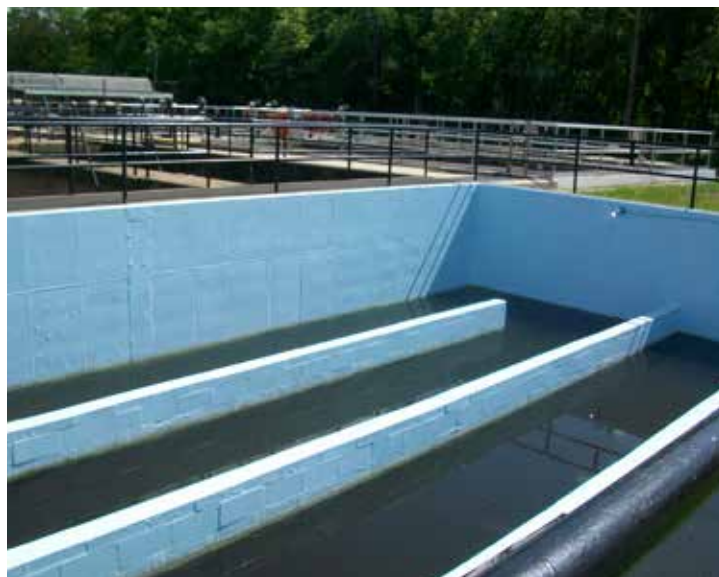
使用贝尔佐纳 (Belzona) 5111 进行氯储罐内壁保护