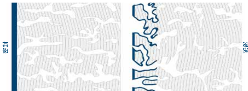
渗透与密封的区别

无需密封基材,贝尔佐纳 (Belzona) 5122 可渗透砌砖、砖石或混凝土,既能提供极佳的防水保护又具备良好的透气性。