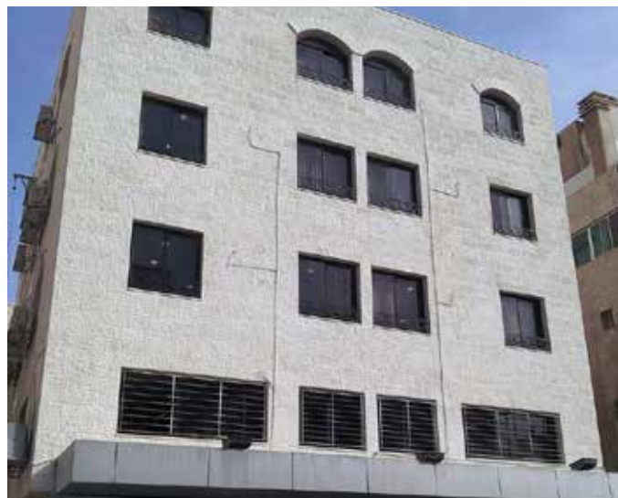
施工于酒店外墙的隐形保护

贝尔佐纳 (Belzona) 5122 有助于减少积垢,以及减缓霉菌、苔藓和地衣的生长。