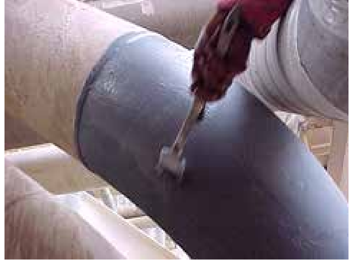
使用贝尔佐纳 (Belzona) 5851 为管道提供腐蚀防护

无需专业工具, 即可敷涂贝尔佐纳 (Belzona) 5841。而且, 对表面处理的要求不高。